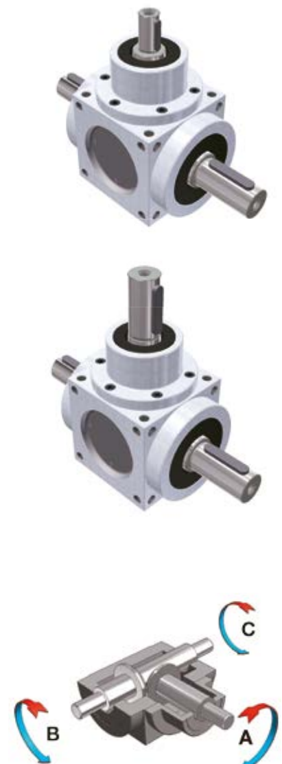
Rotazioni forma costruttiva TIPO 1 TYPE 1 constructive form revolutions

NOTE: The diameter of PTO "B" and "C" is the same for size. For any further information please contact our Technical Dept.