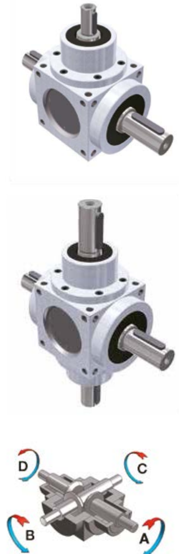
Rotazioni forma costruttiva TIPO 6 TYPE 6 constructive form revolutions

NOTE: The diameter of PTO "A" - "D" and "B" - "C" is the same for size. For any further information please contact our Technical Dept.